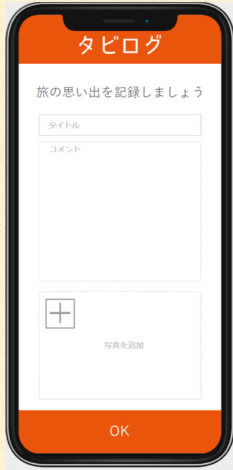
日記記入 (感想, 写真)