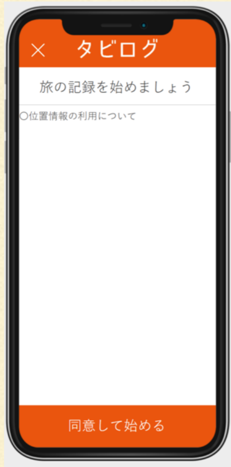
日記記入 (位置情報)